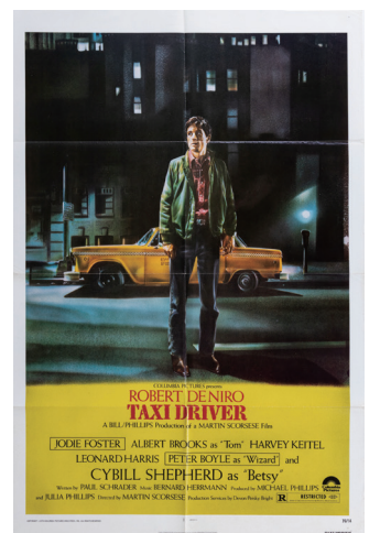
『タクシードライバー』(1976)

※展示資料の画像、上映作品のスチル写真がご提供可能です。 必要な場合は担当までご連絡ください。