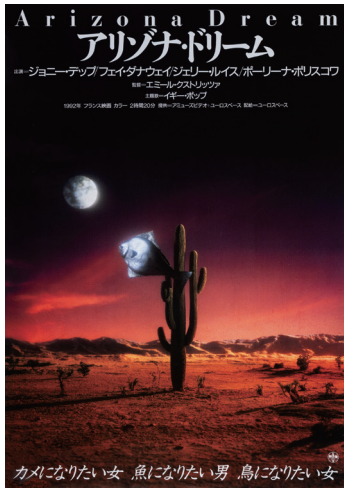
『アリゾナ・ドリーム』(1993)