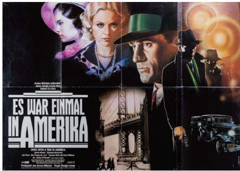
『ワンス・アポン・ア・タイム・イン・アメリカ』(1984)