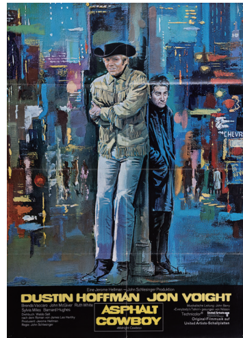
『真夜中のカーボーイ』(1969)