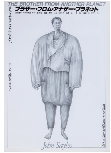
『ブラザー・フロム・アナザー・プラネット』(1984)