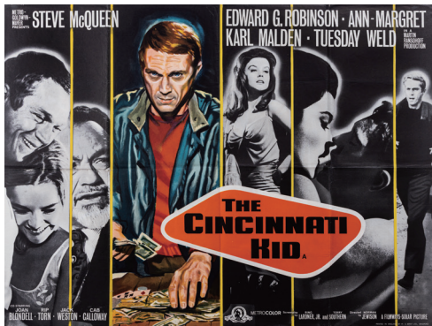
『シンシナティ・キッド』(1965)