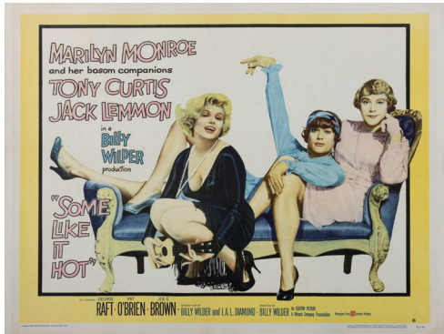
『お熱いのがお好き』(1959)