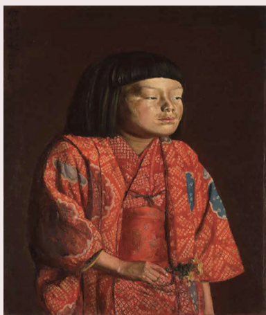
岸田劉生《童女図(麗子立像)》1923年 神奈川県立近代美術館蔵