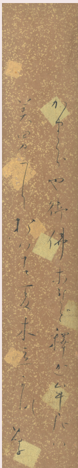
与謝野晶子短冊「かまくらや御仏なれど釈迦牟尼は美男におはす夏木立かな 晶子」 鎌倉文学館蔵