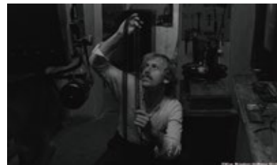
『さすらい<4Kレストア版>』