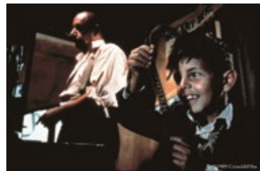
『ニュー・シネマ・パラダイス<インターナショナル版>』

料金：一般 600 円、小・中学生 300 円 チケット発売日：5月11日(土) (展示観覧料含む)