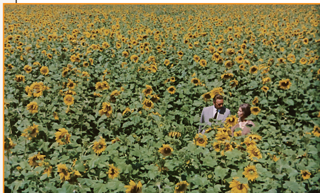
©1970 - COMPAGNIA CINEMATOGRAFICA CHAMPION(ITA) - FILMS CONCORDIA(FR) - SURF FILM SRL, ALL RIGHTS RESERVED.

監督：ルネ・クレマン 原作：パトリシア・ハイスミス 音楽：ニーノ・ロータ 出演：アラン・ドロン、マリー・ラフォレ、モーリス・ロネ、エルノ・クリサ、ビル・カーンズ