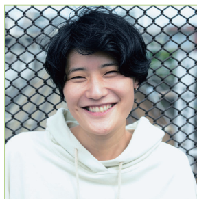
ひろせ ななこ 広瀬 奈々子 監督

1987年神奈川県生まれ。武蔵野美術大学卒業。2011年より分福に所属。是枝裕和監督や西川美和監督のもとで監督助手を務める。2019年に柳楽優弥主演の『夜明け』でオリジナル脚本・監督デビュー。同年12月にドキュメンタリー映画『つつんで、ひらいて』を発表。21年に放送された連続ドラマ『それでも愛を誓いますか?』で監督を務める。