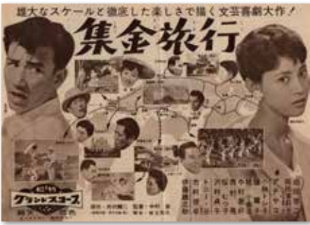
『集金旅行』（1957年）プレスシート