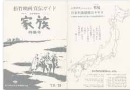
『家族』（1970年）プレスシート

日本映画は、様々な日本の姿を映し出してきました。能登金剛・ヤセの断崖で撮影が行われた『ゼロの焦点』（1961）における断崖のシーンは追い詰められた犯人の不安定な心理を表す重要な役割を果たしました。また